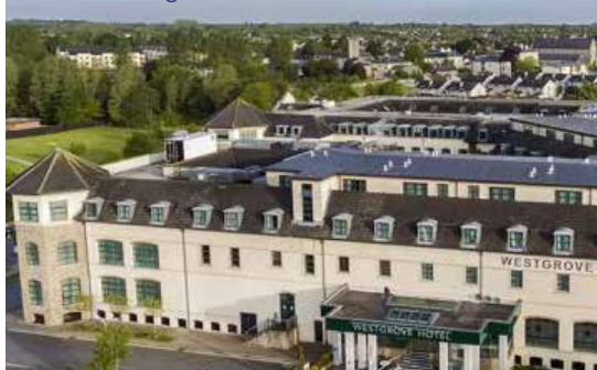
The Westgrove Hotel

in Irland kommt nicht zuletzt auch durch die herzliche Gastfreundschaft und den großen „Craic“ (Irisch für „Spaß“) nach der letzten Runde. Ob bei erlesener Gourmetküche im Gastropub oder handfesten Gerichten im Clubhaus, hier gibt es jede Menge Gelegenheit und Zeit für fesselnde Geschichten über das, was geschehen ist, und das, was hätte sein können... Denn das Clubhaus selbst (oder auch die nächstbeste Einkehr) ist eine kleine Oase, in der Legenden und Erzählungen über triumphale oder auch katastrophale Begebenheiten ausgetauscht werden.