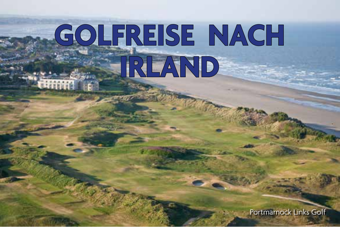
Portmarnock Links Golf